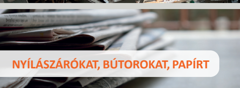
NYÍLÁSZÁRÓKAT, BÚTOROKAT, PAPIRÁT